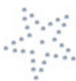
- Single Star -