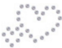
- Double Hearts -