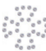
- Iron Cross -