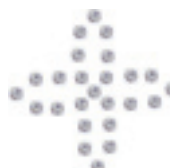
- Cross -