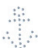
- Anchor -