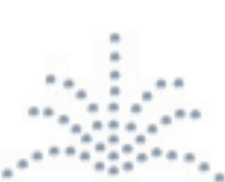
- Fountain -