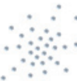
- Spray -