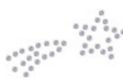
- Shooting Star -