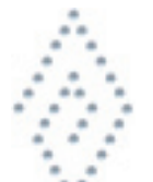
- Aztec Diamond -