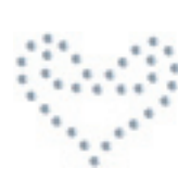
- Single Heart-2 -