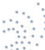
- Half Spray -