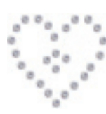
- Single Heart-1 -