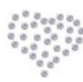
- Full Heart -