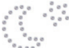
- Moon & Star -