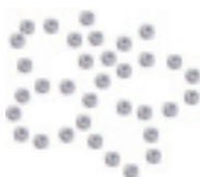
- Butterfly -

10 パックセット： 4,500 円 (税込) 1 パックあたり 450 円 30 パックセット： 12,000 円 (税込) 1 パックあたり 400 円 50 パックセット： 15,000 円 (税込) 1 パックあたり 300 円