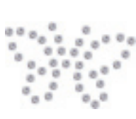
- Butterfly-2 -