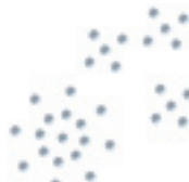
- Multi Rounds -