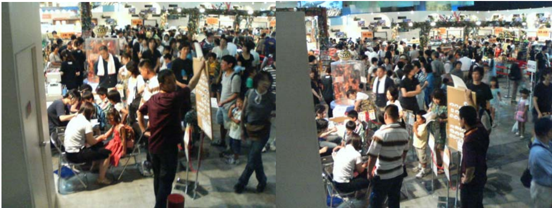
昨年の幕張会場内のペイントブースの様子。多くのお子様ที่ペイントを楽しみました。

本年は規模や地域が異なるため昨年の実績は不確実のところもありますが、お客様には大変喜ばれており、イベントとしては大変盛り上がりしました。さらに、イベントとして有料で行うことにより販売にも貢献できます。