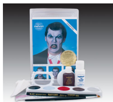
吸血鬼・キット キャラクターと言えば吸血鬼