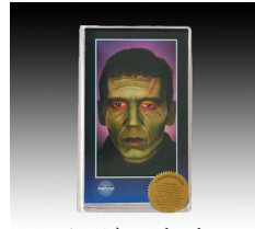
モンスター・キット フランケンに