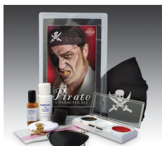
海賊・キット 簡単に海賊に