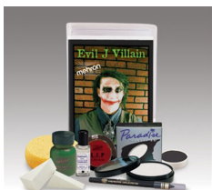
悪者・キット 悪いやつより悪くなる