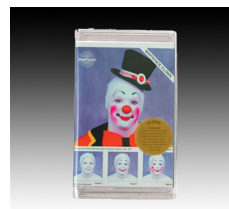
クラウン・キット ピエロ!!