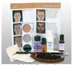
オオカミ男・キット スリラ〜♪