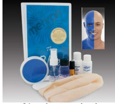
ブルーパーソン・キット 青〜マン