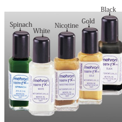
Blood Red-No Image

歯に特殊効果を施すペイント材。無害の安全なインクで口に入れても問題なし。より完璧な特殊効果を出すためには、コスチュームだけでなく細かな部分を処理することが必要。歯磨きするだけで簡単に落とせる。全6色