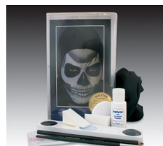
骸骨・キット ハロウィンならこれ!!