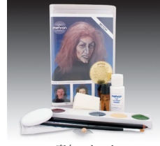
魔女・キット 毒入りリンゴを持って完璧