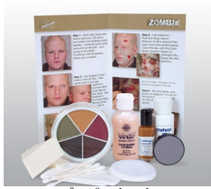
ゾンビ・キット スリラ〜♪